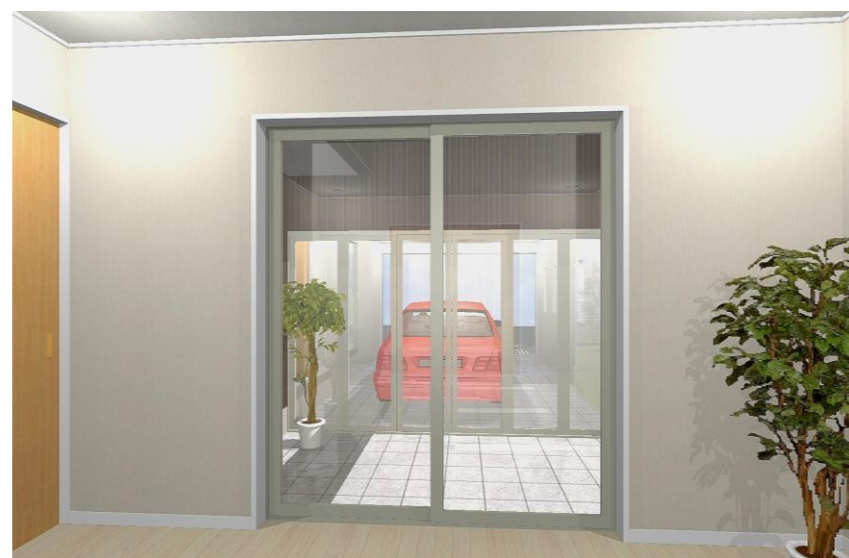
※参考プランイメージ (寝室からガレージを見たところ)